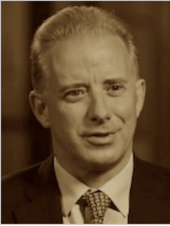
Christopher Steele

waren, der für die Zusammenstellung der Seiten beauftragt wurde von einer politischen Beraterfirma mit Namen 'Fusion GPS', welche von der Anwaltskanzlei Perkins Coie bezahlt wurde, die wiederum mehrere Millionen von Hillary Clintons Politikampagne DNC erhielt.