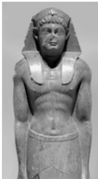
Joven gobernante egipcio con carácter greco-romano, potencialmente Cesarión

Los sucesos históricamente verificables del antiguo Egipto revelan que bastantes historias bíblicas se correlacionan significativamente con los incidentes escritos con jeroglíficos de los faraones y sus herederos. Uno de ellos es especialmente interesante. El emperador romano Julio César conoció a la famosa Cleopatra de Egipto en el año 48 a.C., tuvieron un romance y Cleopatra dio a luz a un hijo llamado Cesarión de esa relación. Cuatro años después, Ceasar fue asesinado en Roma. Cleopatra esperó en Roma a que el pequeño Cesarión fuera nombrado heredero de su padre, pero se enteró de que el sobrino nieto de César, Octavio, había sido elegido como nuevo emperador de Roma, probablemente con un apoyo político romano decisivo. La línea de sucesión del emperador era algo serio y potencialmente mortal en aquella época, por lo que Cleopatra regresó a la segura Alejandría con Cesarión, donde Cleopatra comenzaría un romance con otro poderoso romano: Marco Antonio.