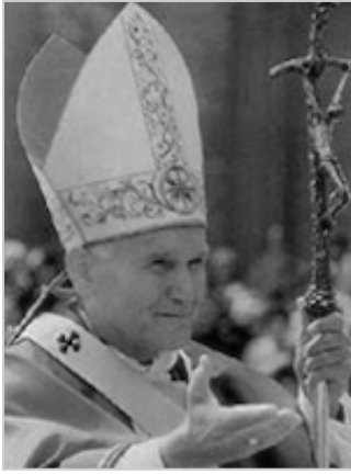
El Papa Juan II.

sino también contra los propios griegos ahora. Al igual que los griegos, la mayoría de los romanos creían en un conjunto de muchos dioses en los inicios del imperio, atribuyendo incluso cada uno de los planetas del cielo a un dios. Los romanos también tenían muchos sumos sacerdotes en lugar de un solo intermediario. La antigua y estricta visión egipcia de un gobernante piramidal con un solo Dios mediador en la cima estaba claramente bajo ataque en dos frentes, liderados por los griegos y los romanos ahora.