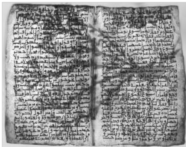
Las primeras escrituras bajo el filtro azul UV

Extrañamente y por coincidencia, justo en medio de la situación de amenaza a la vida de Egipto alrededor del año cero, una serie de reuniones de peregrinos que pasaban por el Sinaí -muy probablemente en su ruta de escape dejando urgentemente la provincia recientemente hecha por los romanos, Egipto- marcaron el comienzo de otra operación de rescate de la cúpula piramidal.