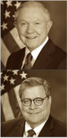
Sessions / Barr

bajo la dirección de William Barr, emitió la acusación sustitutiva contra Assange.