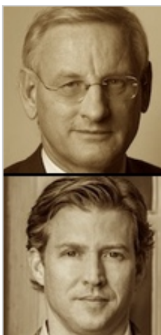
Bildt / Ross

Tal vez esa confidencialidad se deba a una reunión política de alto nivel que tuvo lugar poco después de estos acontecimientos de Gotemburgo. El 6 de septiembre de 2010, sólo cinco días después de que unos viciosos Knullkompis se deshicieran del fiscal jefe Finné y de que todo el caso se transfiriera a Marianne Ny, se produjo una extraña reunión entre el ex primer ministro sueco Carl Bildt y Alec Ross,