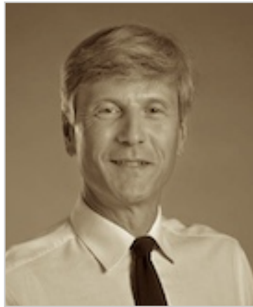
El Padre B.

Clave y útil para tal ataque verdaderamente vicioso de septiembre puede haber sido el padre de la demandante conjunta,