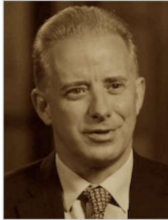
Christopher Steele

publiquement, une procédure de destitution a été lancée par le parti démocrate américain contre leur propre président républicain, qui a également échoué lamentablement.