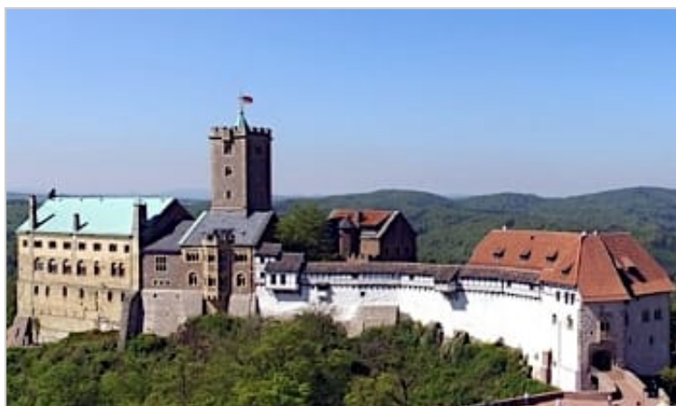
La "Wartburg" di Eisenach, in Germania

Comment cela s'est-il réellement produit à l'époque, le 2 juillet 1505, alors que vous étiez censément entré dans cet «orage» et que, après votre évasion céleste, sauvé d'un éclair qui aurait frappé juste devant vos