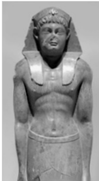
Il giovane sovrano egiziano con un personaggio greco/romano, potenzialmente Cesarione

Gli avvenimenti dell'antico Egitto, storicamente verificabili, rivelano che non pochi racconti biblici sono correlati in modo significativo con gli episodi scritti in geroglifico dei faraoni e dei loro eredi. Una di queste è particolarmente interessante. L'imperatore romano Giulio Cesare incontrò la famosa Cleopatra nel 48 a.C., ebbero una relazione e Cleopatra diede alla luce un figlio di nome Cesarione. Quattro anni dopo, Cesare fu assassinato a Roma. Cleopatra attese a Roma che il piccolo Cesarione diventasse l'erede del padre, solo per scoprire che il pronipote di Cesare, Ottavio, era stato scelto come nuovo imperatore di Roma, probabilmente con un decisivo sostegno politico romano. La linea di successione dell'imperatore era una cosa seria e potenzialmente mortale a quei tempi, così Cleopatra tornò al sicuro ad Alessandria con Cesarione, dove Cleopatra avrebbe iniziato una relazione con un altro potente romano: Marco Antonio.