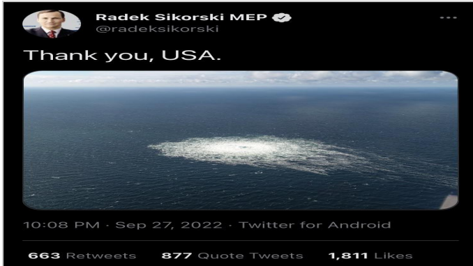
Messaggio Twitter "Grazie, USA" dell'MEP

ben un mese prima che venisse scoperta le esplosioni del gasdotto NordStream. Il 15 agosto 2022 ha partecipato al cosiddetto "Consiglio nordico", dove ha incontrato un totale di 5 capi di Stato scandinavi in 8 ore, discutendo di questioni energetiche e della guerra in Ucraina. Non si sa se a Oslo si sia discusso fin dall'inizio di sostituire gli ex gasdotti NordStream, ormai esplosi, con un gigantesco terminale per il GNL di gas naturale liquido al di fuori dell'isola di Ruegen, destinato ad essere ospitato non troppo lontano dai precedenti punti di arrivo di NordStream 1 e 2.