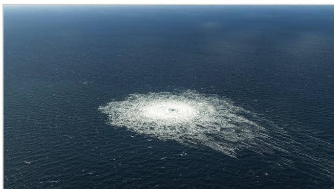
Il sito dell'esplosione del gasdotto Nord Stream

A quanto pare, una piccola area nella città polacca di Danzica o nelle sue vicinanze si rifiuta di aderire ai veri valori cristiani, ancora oggi. Un migliaio di anni dopo, il 26 settembre 2022, non lontano da Danzica, il mondo intero è rimasto scioccato nel vedere una gigantesca bolla esplodere sulla superficie del Mar Baltico a seguito di un totale di tre esplosioni vicino ai gasdotti Nord Stream sul fondo del mare.