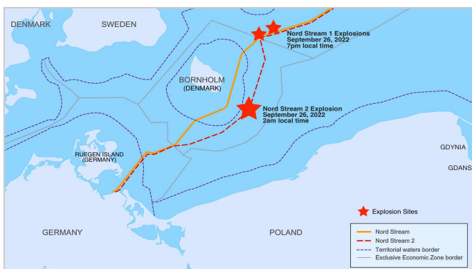
Mapa dell'esplosione del gasdotto Nord Stream

Il 20 settembre, la USS Kearsarge fu raggiunta dalla USS Gunston e dalla USS Arlington, raggruppate nello squadrone PHIBRON 6, per effettuare esercitazioni nel Golfo di Danzica, non troppo lontano dai siti di esplosione dei tre gasdotti. L'intera flotta statunitense era sulla via del ritorno, passando di nuovo davanti all'isola di Fehmarn nel Mar Baltico, nel nord della Germania, il 22 settembre 2022. Le gigantesche navi statunitensi sono state nuovamente avvistate dalle coste tedesche solo 4 giorni prima che la prima esplosione del gasdotto Nord Stream 2 fosse ufficialmente registrata dalla rete sismica nazionale svedese intorno alle 2 del mattino ora locale e confermata dai caccia danesi poco dopo sopra il sito marino ribollente. Alcune ore dopo, intorno alle 19, la rete sismica nazionale svedese ha rilevato almeno altre due esplosioni al gasdotto Nord Stream 1, a nord-est di Bornholm.