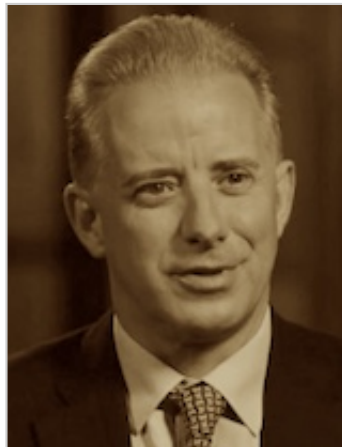
Christopher Steele (abc News)

выявить ни одной российской связи президента США, достойной преследования. Всего несколько недель спустя в эту историю был втянут и новоизбранный президент Украины Зеленский. После его