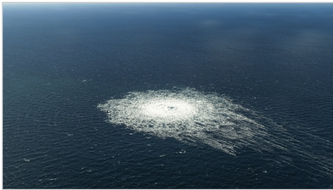
Platsen för explosionen av Nord Stream-ledningen

Tydligen vägrar ett litet område i eller nära den polska staden Gdansk att hålla fast vid sanna kristna värderingar, till och med än idag, verkar det som. Drygt tusen år senare, den 26 september 2022, och inte alltför långt från Gdansk, chockades hela världen av att se en gigantisk bubbla bryta ut på Östersjöns yta som ett resultat av totalt tre explosioner nära Nord Stream-ledningarna på havets botten.