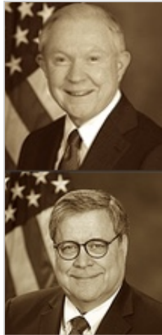
Sessions / Barr