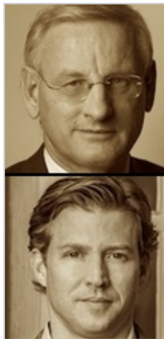
Bildt / Ross