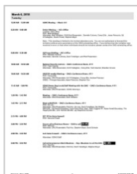
FOIA Kalender DAG Rosenstein 2018